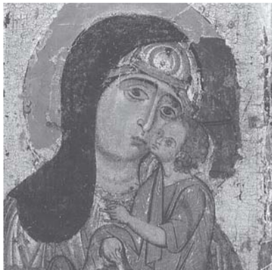
И под покровом – Девушкой Марией не забыта, К любви зывает МАТЬ В укор антисемитам...