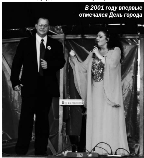
В 2001 году впервые отмечался День города

– 2002 год был действительно годом начала строительства в городе. Причем необходимо отметить, что предыдущие два года ушли на поиски инвесторов, потому что одной из основных задач для себя я ставил поиск возможностей для привлечения инвестиций в город. На это ушло практически полтора года: в то время в наш город – без коммуникаций, без сетей, без достойного внешнего вида – никто просто не хотел идти. И только в 2002-м году удалось найти пути решения этой