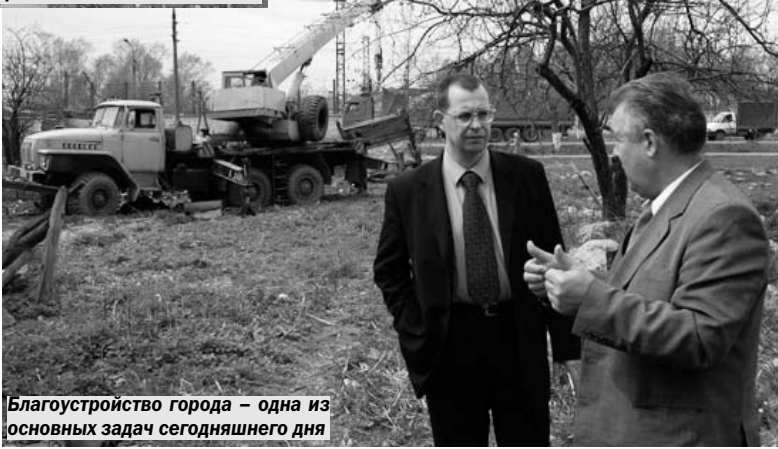
Благоустройство города – одна из основных задач сегодняшнего дня

Пример такого подхода – дом на Юбилейной