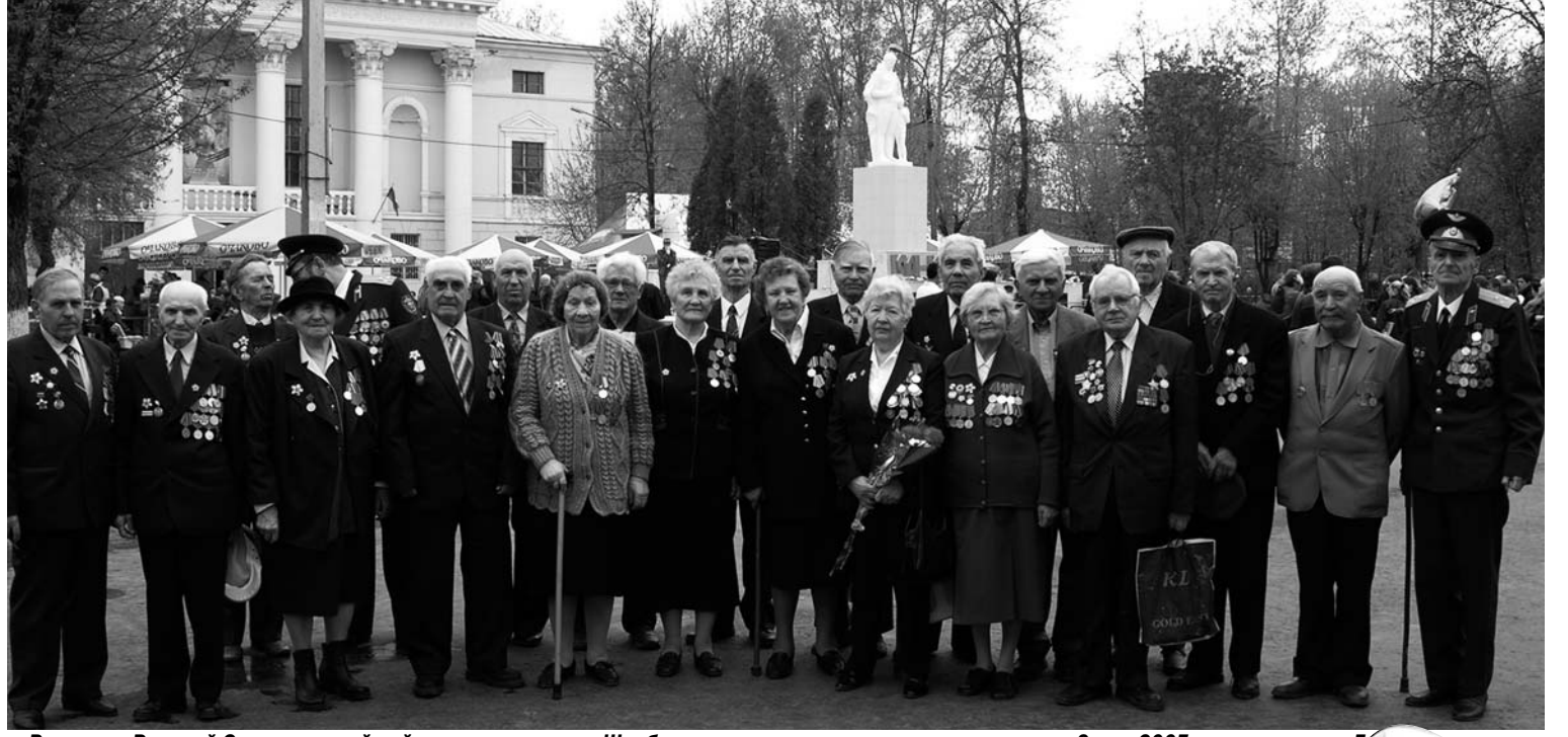
Ветераны Великой Отечественной войны, жители города Щербинки, участники торжественного митинга 9 мая 2005 г. на площади у Дворца культуры