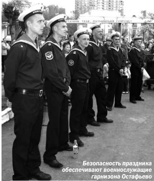
Безопасность праздника обеспечивают военнослужащие гарнизона Остафьево