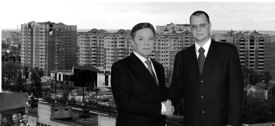
Глобальная задача построить новый город – вполне осуществима

юсь в проценты, но, тем не менее, они отражают мой реальный политический, административный и хозяйственный рейтинг в городе. Он объективный, и если две трети населения довольны моей деятельностью в городе – это нормальное достижение. Но я считаю своей задачей, чтобы и остальные жители города вошли в это число.