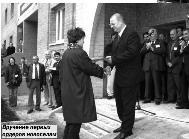
Вручение первых ордера новоселам

Кроме того, в 2002 году были продолжены работы по благоустройству города.