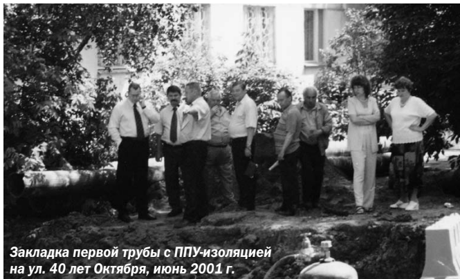
Закладка первой трубы с ППУ-изоляцией на ул. 40 лет Октября, июнь 2001 г.