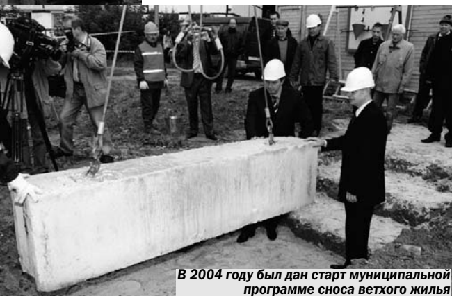
В 2004 году был дан старт муниципальной программе сноса ветхого жилья

– Основной задачей для себя, как я уже говорил, я считаю снос ветхого фонда. И та доля квартир, которую город получает от инвесторов, будет в первую очередь идти на расселение жителей подлежащих сносу домов. В городе, как известно, свободных площадок нет, и мы должны освобождать новые площадки за счет сноса отслуживших своё строений. По этому вопросу моя позиция ос-