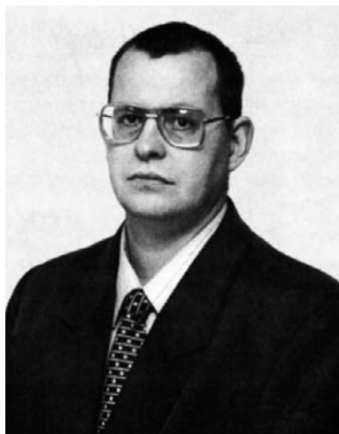
«В 2000 году работа только начиналась. Для меня это был период вхождения во все вопросы.»